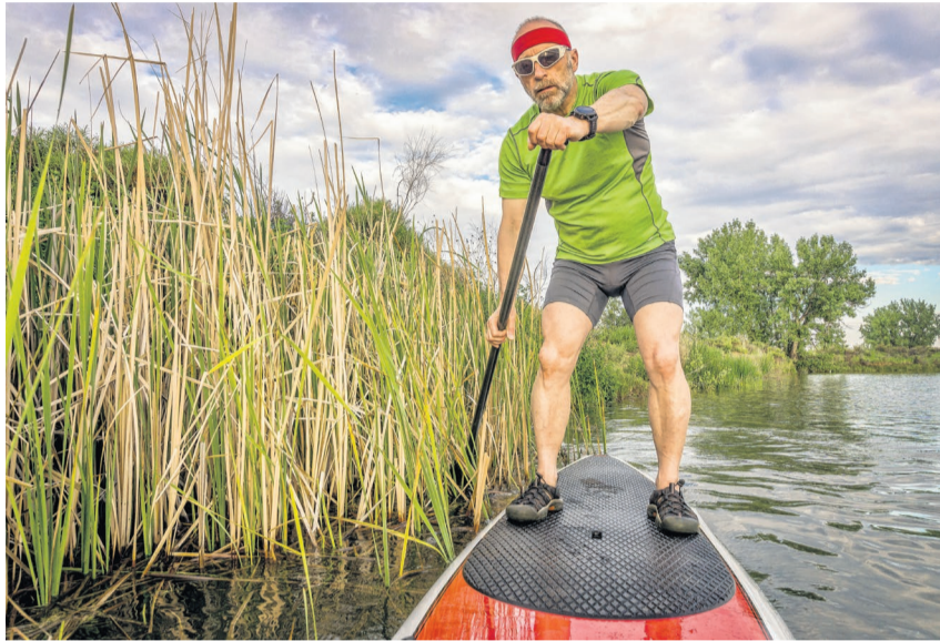
Die Silhouette eines Menschen wirkt für viele Vögel bereits auf grosse Distanz als Bedrohung. Ein Abstand von mindestens 100 m zum Schilfgürtel sollte eingehalten werden.

Mit der Kampagne «Aufs Wasser mit Rücksicht» informiert der Verein «Natur und Freizeit» darüber, wie sich Wassersport auf Wildtiere und ihren Lebensraum auswirkt. «Wir wollen den Erholungssuchenden und Sportaktiven, insbesondere im Paddelsport, aufzeigen, wie sie sich auf dem Wasser naturfreundlich bewegen können», sagt Reto Solèr, Leiter der Kampagne. «Mittlerweile führen wir die Kampagne an elf Schweizer Seen durch und arbeiten dafür eng mit den Kantonen, den Seegemeinden sowie den Akteuren aus